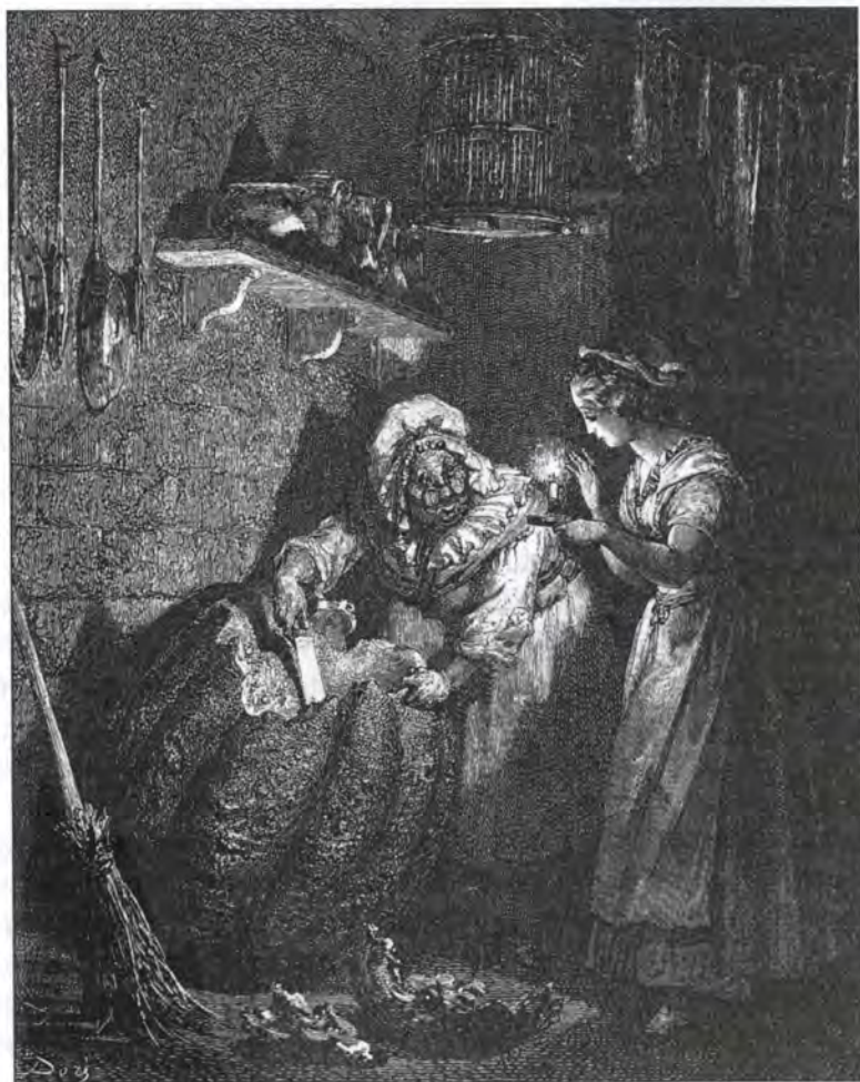
Г. Доре. Ілюстрація до казки «Попелюшка, або Соболевий черевичок»