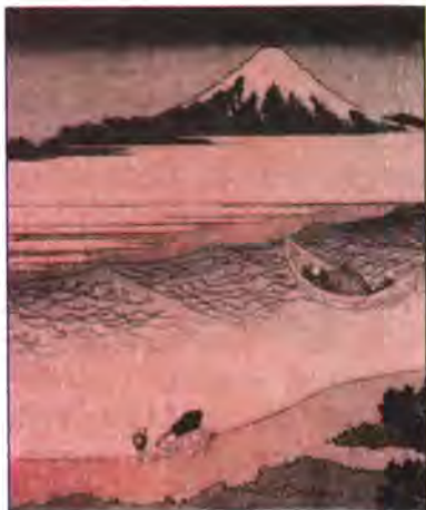
Хокусай. Гора Фудзі (фрагмент)

Ви також можете помітити знайомі вам «сезонні слова» у поданих нижче замальовках весняної природи: