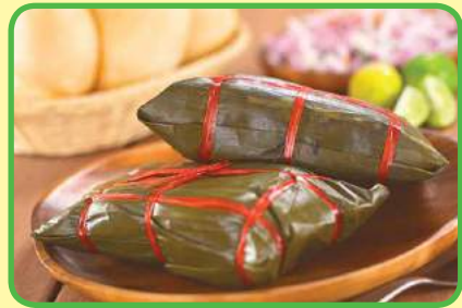
los nacatamales (las hojas de plátano con un relleno)