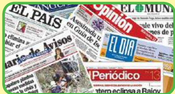
la prensa impresa