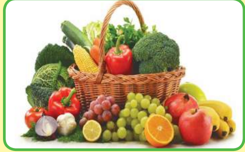
las hortalizas (también verduras)