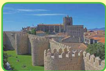
Ávila, la ciudad medieval, Castilla y León.

2. Observad los lugares y monumentos declarados los Patrimonios de la Humanidad en España.