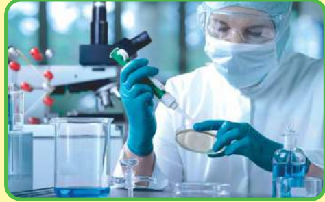
la ingeniera en nanotecnología médica