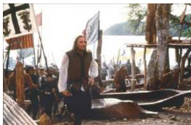
el cuadro de la película