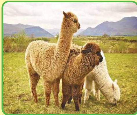
La alpaca, animal de la región andina.