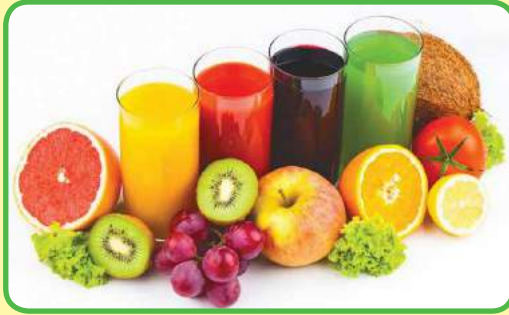
los zumos naturales