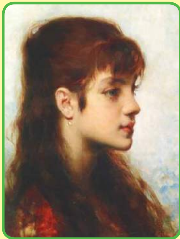
María Bashkirtseva, autorretrato