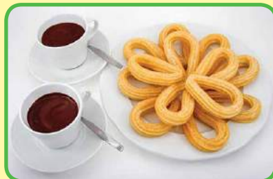
los churros con chocolate caliente