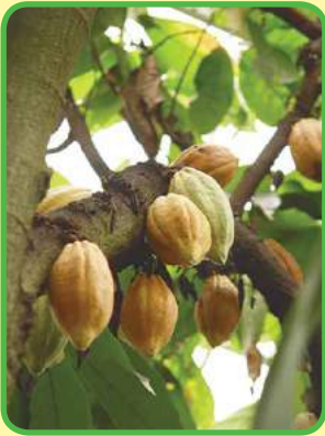
El cultivo de cacao.