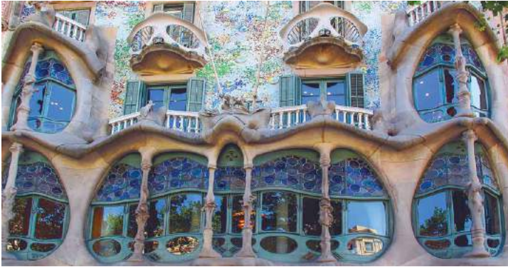
La Casa Batlló (fachada), Barcelona

En el año 1873, se matriculó en la Escuela de Arquitectura. Mientras estudiaba, se ponía a trabajar en varios talleres de arquitectos. Él imaginaba una cosa y, a la vez sabía cómo hacerla realidad, porque conocía unos oficios artesanos: de escultor, de carpintero y explicaba a los obreros que trabajaban con él.