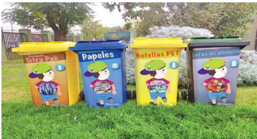
Los contenedores de reciclaje en el patio del colegio.

estar consciente de – усвідомлювати (щось)