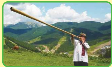
Los Cárpatos en verano, región Ivano-Frankivsk.