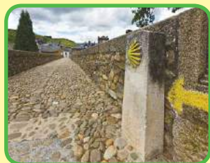
El Camino de Santiago, Galicia.