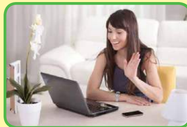
comunicarse en el tiempo real