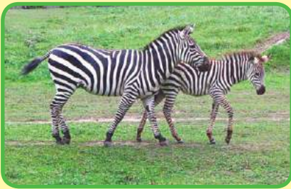
La Reserva Nacional Askania-Nova, región Jersonska.