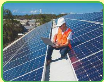
El ingeniero eléctrico en la planta de energía solar.