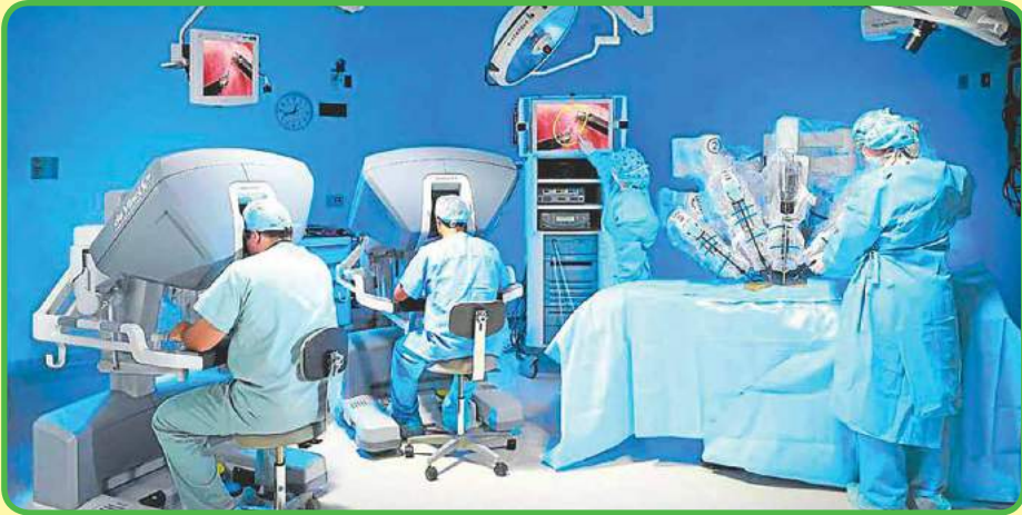
los ingenieros hospitalarios