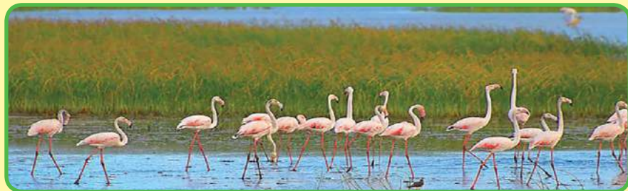
El Parque Nacional de Doñana, Andalucía.

3. ¿En qué comunidad autónoma se encuentran estos monumentos de arquitectura que son el Patrimonio de la Humanidad?