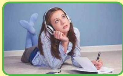
escuchar música en línea