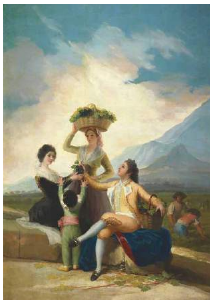
“La vendimia”, Francisco de Goya, el Museo del Prado