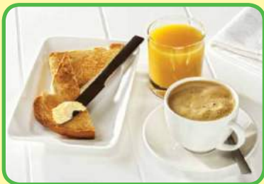
el café, las tostadas, el zumo de naranja