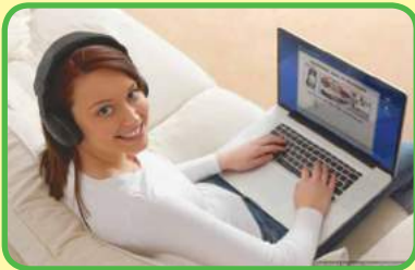
hacer compras por Internet