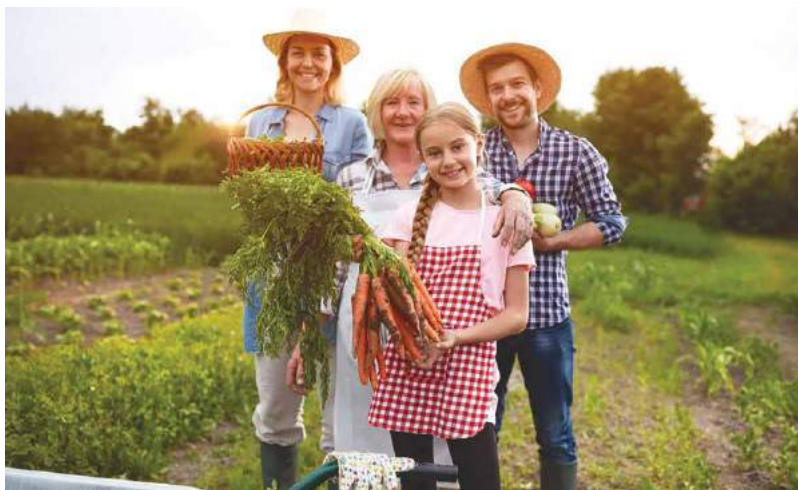
El negocio familiar: la agricultura ecológica

montar un negocio – заснувати справу (бізнес) trabajar en equipo – працювати у команді distribuir las tareas – розподіляти завдання encargarse de – брати на себе (обов'язки, роботу тощо) el marketing y la distribución – маркетинг і продажі el salario – зарплата, винагорода