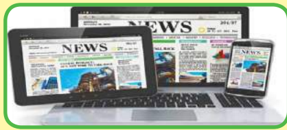
la prensa digital