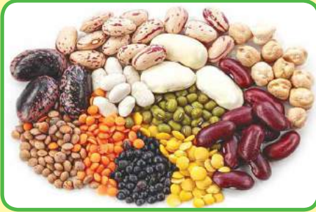
las legumbres (soja, frijol, haba, guisante)