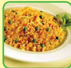
la sopa de pescado, la ensalada de verduras y la carne con arroz