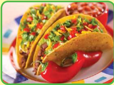
los tacos mexicanos (la tortilla de maíz con un relleno)