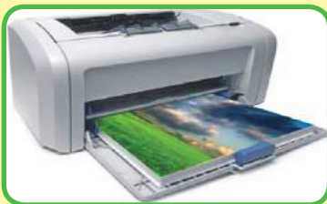
imprimir la foto en la impresora