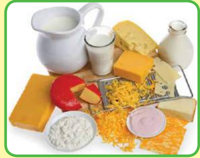
los (productos) lácteos