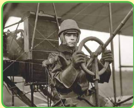
Ígor Sikorskiy, diseñador de aeronaves.

Volodýmyr se fue a los Estados Unidos. Él músico posee 25 Premios Grammy 1 . Los discos con sus grabaciones se convirtieron en verdaderos éxitos de ventas.