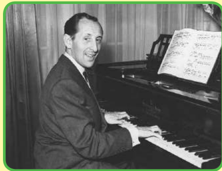
Volodýmyr Górovys, famoso pianista.

glorificar – прославляти el helicóptero – вертоліт diseñar – конструювати la aeronave – літальний апарат