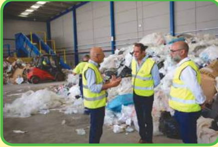
el ingeniero de reciclaje