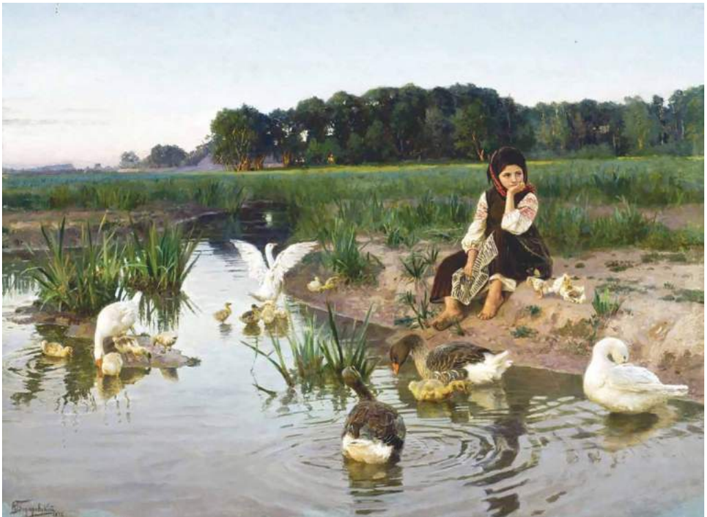
“La niña ucraniana con los gansos”, Mykola Bodarevskiy