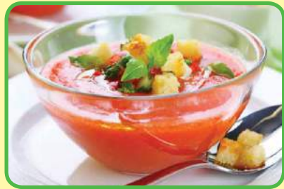
el gazpacho (la sopa fría de tomate)