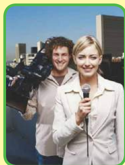
La periodista y el operador haciendo un reportaje.