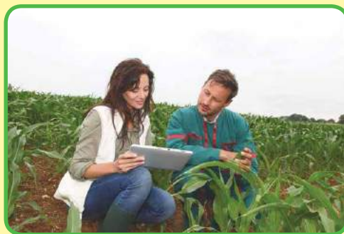
Los agrónomos están trabajando en el campo.