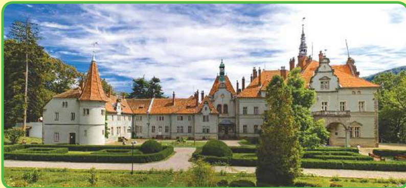
El palacio-castillo de los condes Shenborn (графів Шенборнів), cerca de Úzhgorod.