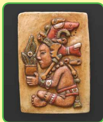
El diós de maíz, cultura azteca.