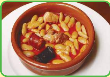
la fabada asturiana (frijoles con chorizo, morcilla, tocino)