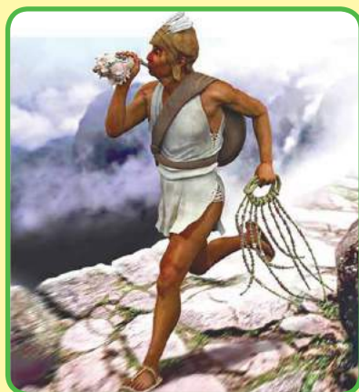
El chasqui lleva el quipu, cultura inca