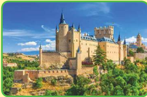
El Alcázar de Segovia empezó como la fortaleza árabe.