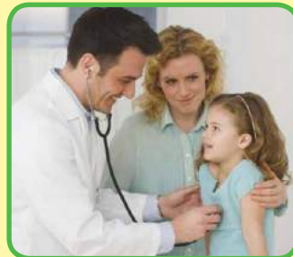
El médico pediatra atiende a una niña en el hospital.