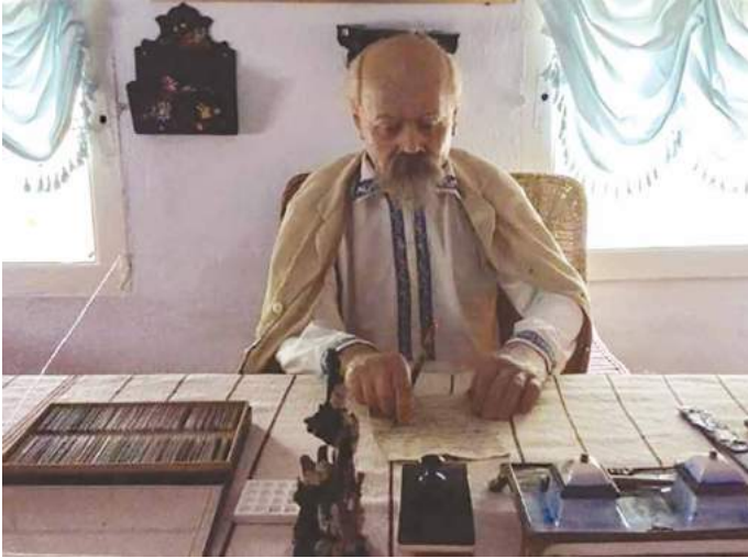
La exposición de la Casa Museo del pueblo Zabolotne (región de Vínnytsia), el despacho.

El microbiólogo y epidemiólogo Danylo Zabolotniy hizo muchas cosas la primera vez. En 1898, organizó la primera cátedra de bacteriología; en 1928, fundó el Instituto de Microbiología y Epidemiología en Kyiv, escribió el primer manual sobre la epidemiología y organizó el primer laboratorio anti-plaga.