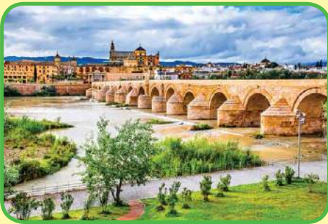
El puente romano en Córdoba en el río Guadalquivir.